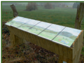
Table d'orientation : sur le chemin menant à Post au départ du Chemin des Ecoliers, la table vous en apprendra plus sur la Hämmelsmarch, le village de Post, la motte féodale du Burgknapp, le village de Nobressart, l'ancienne voie du tram et le paysage ainsi que la forêt.